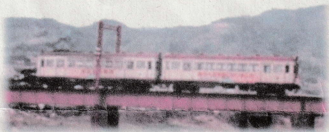
和食川鉄橋・土佐電鉄 さよなら電車